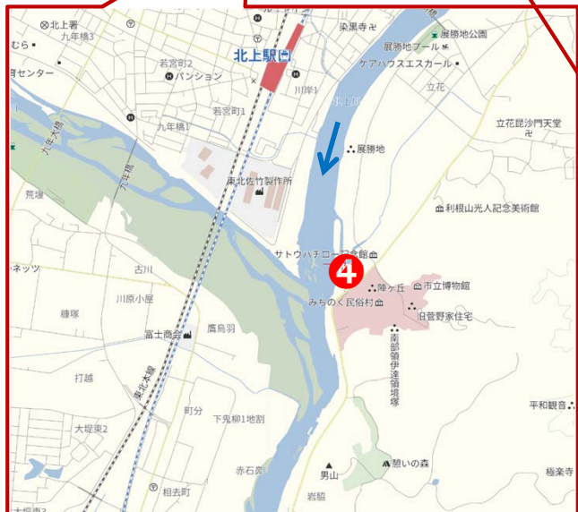
④ 2日目到着(展勝地レストハウス:左岸) 59km(13 km)