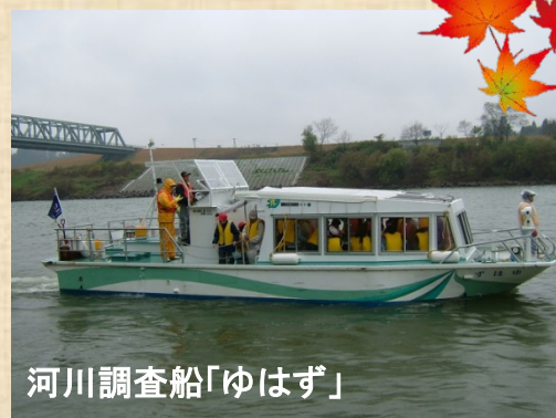
河川調査船「ゆはず」

同会場にて「北上川サケまつり (主催:北上川サケ祭り実行委員会)」も開催中です。