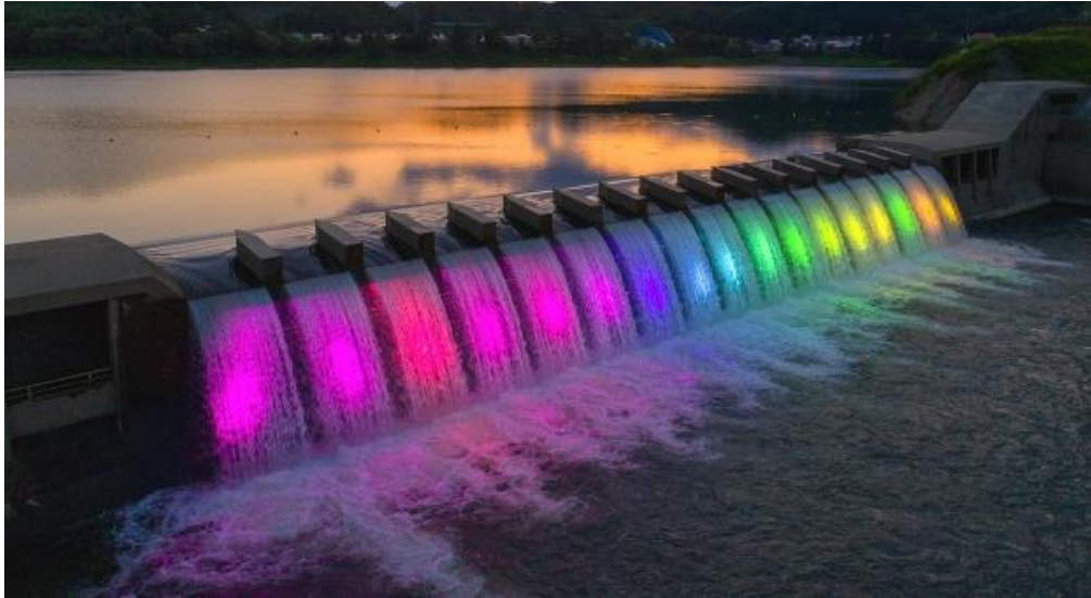
▶ 錦秋湖大滝ライトアップ