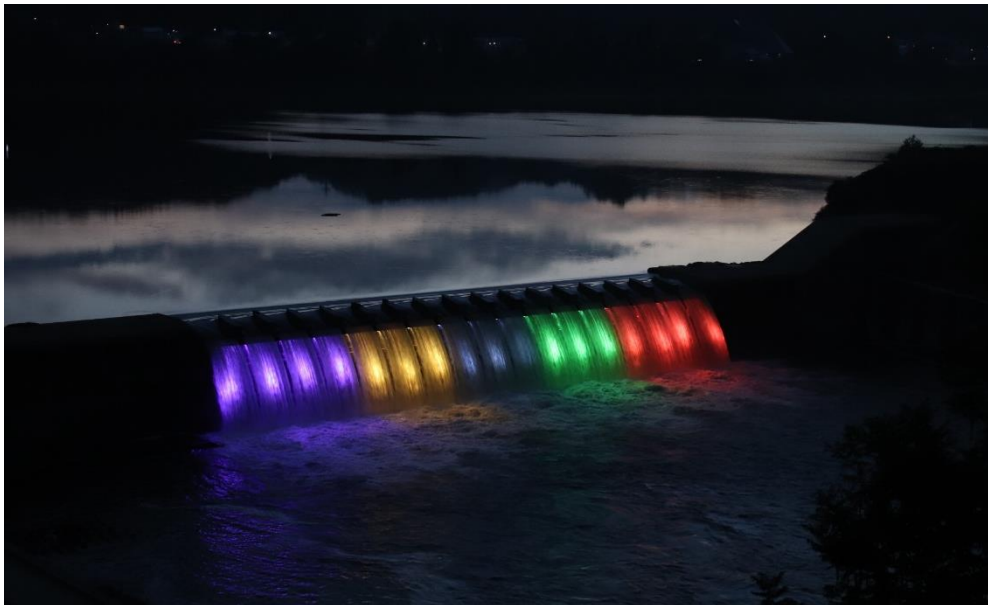
東京五輪2020カラーライトアップ